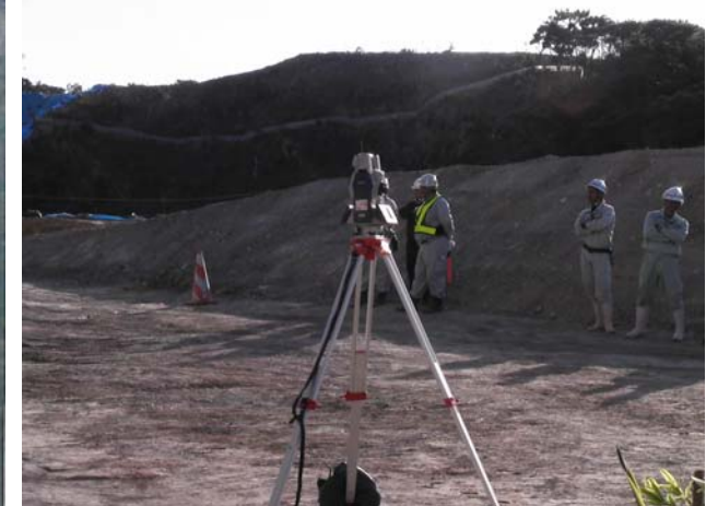
TSによる出来形管理デモンストレーション